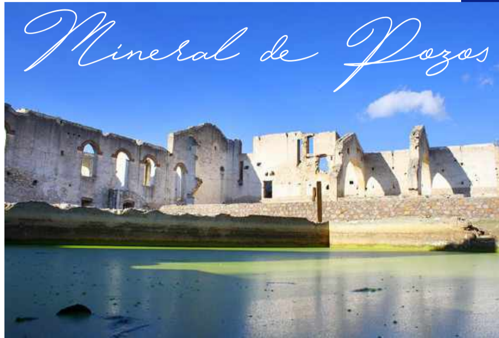
Mineral de Pozos